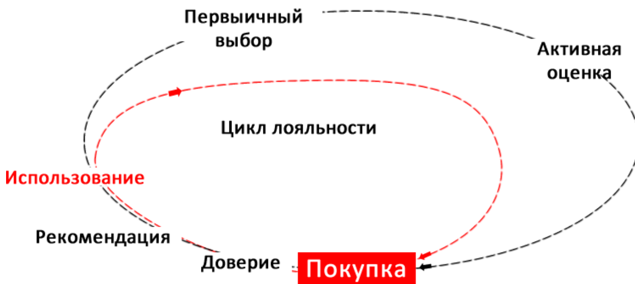
Рисунок 3 – Схема «траектории поиска» современного покупателя.

2. Активная оценка. На этой стадии количество вариантов часто увеличивается, так как потребитель собирает отзывы о товарах и рекомендации: обращается к знакомым, читает статьи, разговаривает с продавцами магазинов, посещает сайты разных производителей. Обычно по мере того, как он узнает о товаре все больше и больше, его критерии отбора меняются и он включает в поле рассмотрения новые бренды, а какие-то из прежних отбрасывает. На этом этапе информация, которую человек добыл сам, то есть получил в результате собственных усилий, влияет на его решение сильнее, нежели реклама или любое навязывание.