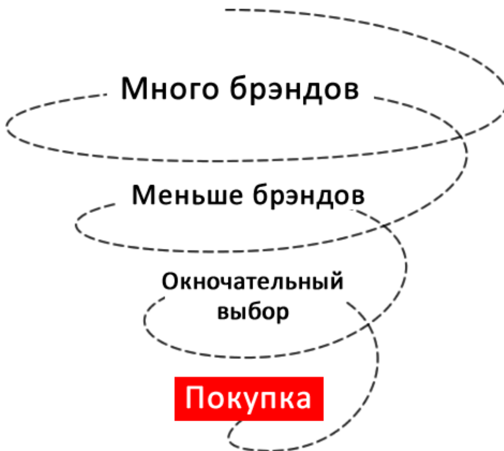
Рисунок 2 – Схема «потребительской воронки».

Ранее считалось, что потребитель начинает свой выбор с большего числа вариантов и постепенно сужает их круг, пока не примет окончательное решение – так называемая «потребительская воронка». В послепродажный период взаимодействие потребителя с брендом обычно ограничивалось использованием приобретенного товара или услуги. (рисунок 2)